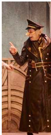
Sábado 10 de febrero 20:00 h. Sala Florida YLLANA