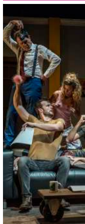
Sábado 2 de marzo 20:00 h. Sala Florida BURUNDANGA