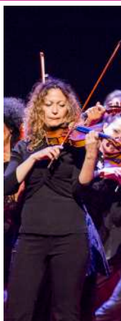
Sábado 9 de marzo 20:00 h. Sala Florida ORTHEMIS