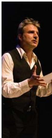
Sábado 17 de febrero 20:00 h. Sala Florida ALBERTO SAN JUAN